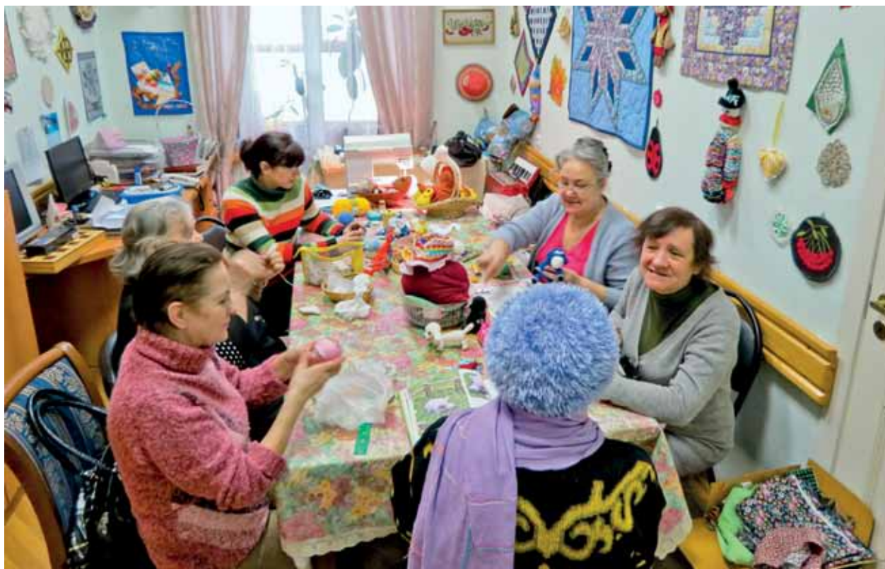
Рукодельницы из клуба «Лоскуток»

но, несмотря на солидный возраст: такие машинки выпускались в 1870-х годах.