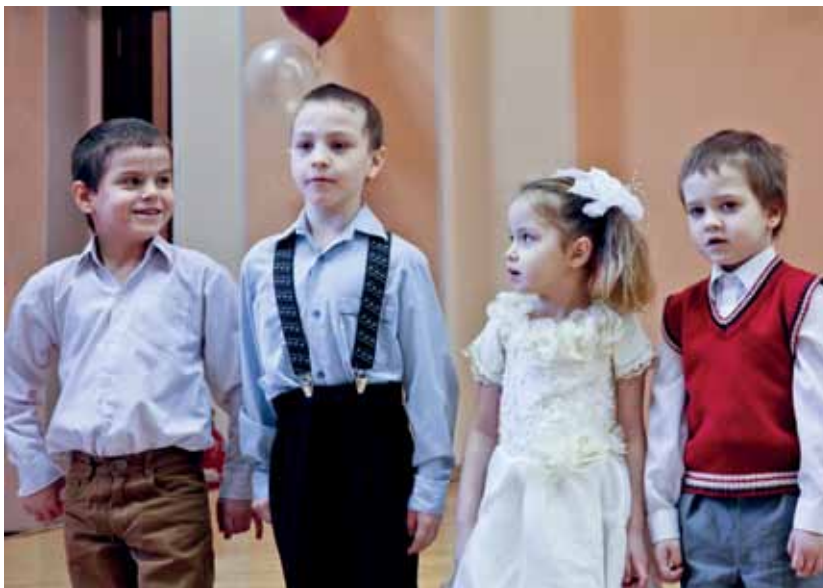
Посмотрите, какие мы нарядные!

Некоторые мальчишки, отслужив срочную службу, остаются в армии по контракту. Уважение к профессии военного закладывается в Центре: здесь хорошо поставлена военно-патриотическая работа. Среди выпускников немало и тех, кто получил или получает высшее образование.