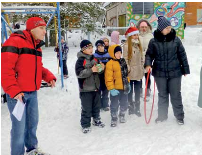
Отдых в зимнем лагере