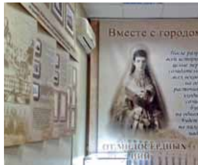
На стене – портрет императрицы Марии Фёдоровны