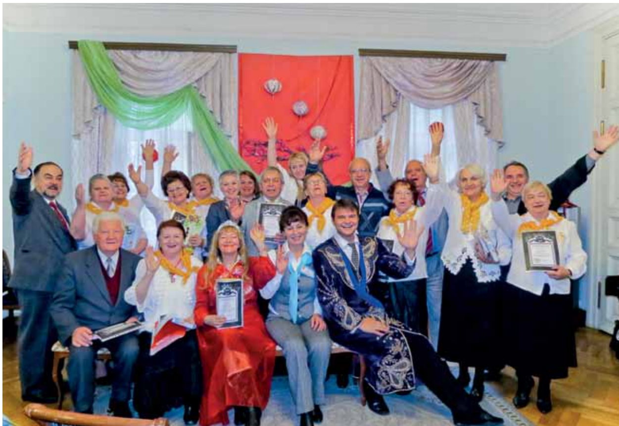
Хор «Мы – арбатцы»