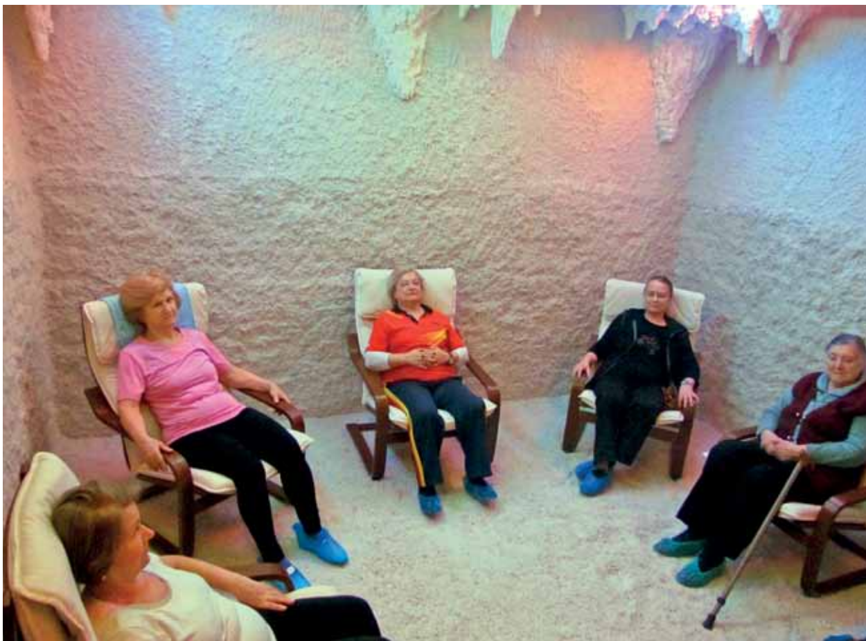
В гелиокамере. Слова «душа» и «дышать» – одного корня