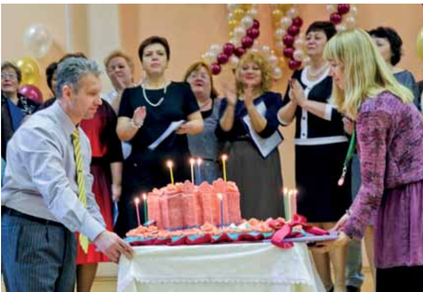
Каравай вот такой вышины, вот такой ширины!

Почти все выпускники Центра так или иначе поздравили свой «дом» с юбилеем. А в домовом храме при Центре уже крещены четверо младенцев – дети выпускников. «Наши внуки», – называет их директор. ■