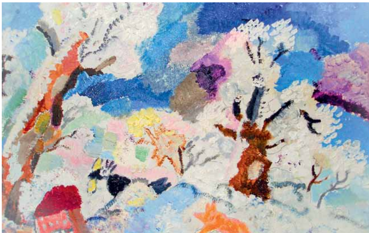
Работа клиентов студии арт-терапии

Красивое двухэтажное здание в Трубниковском переулке, 21, хорошо известно жителям района Арбат. В этом особняке с 2002 года размещается ГБУ Территориальный центр социального обслуживания «Арбат». На двух этажах расположенного по соседству районного Управления социальной защиты населения находится отделение реабилитации инвалидов территориального центра.