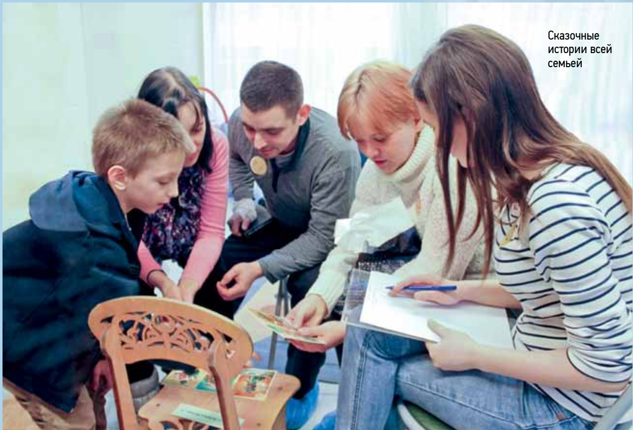
Сказочные истории всей семьей