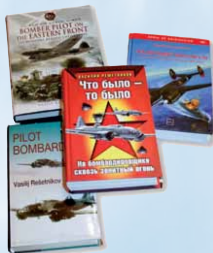
Издания книги «Что было, то было» на разных языках

9 мая 2010 года страна торжественно отмечала 65-летие Великой Победы. В праздничном воздушном параде над Красной площадью принимали участие современные сверхзвуковые стратегические бомбардировщики-ракетоносцы ТУ-160. К слову, лучший в мире ракетоносец был разработан и принят на вооружение при активном участии тогдашнего командующего Дальней авиацией В.В. Решетникова. Летчики называют этот самолет «Белым лебедем» за изящество и гармонию пропорций. Каждая