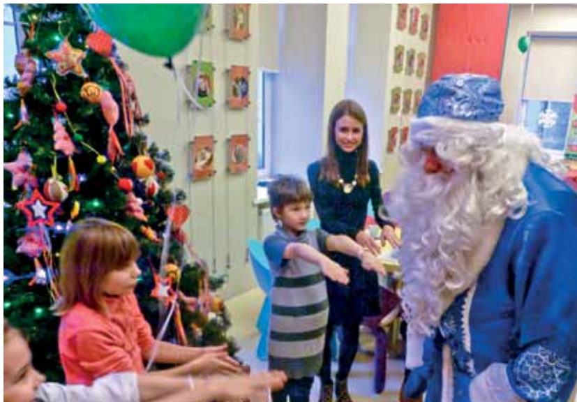
Ёлка в клубе «Пампа Грин»

Кандидаты проходят в детском доме школу обучения и получают документ об окончании ШПР – «Школы приемных родителей».