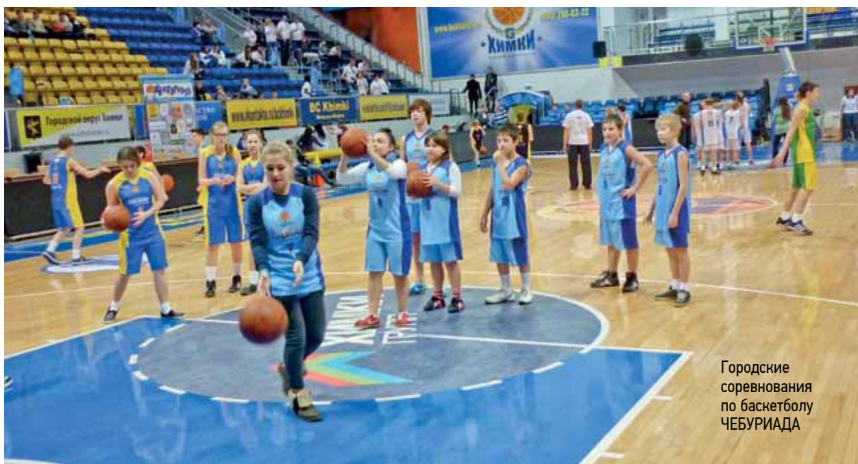
Городские соревнования по баскетболу ЧЕБУРИАДА

Мы решили наладить связь с Северо-Восточным обществом многодетных семей. Пригласили их к себе на праздник 1 июня. После этой встречи у нас взяли двух подростков. Ушли сотый и сто первый ребенок: наш своеобразный рекорд.