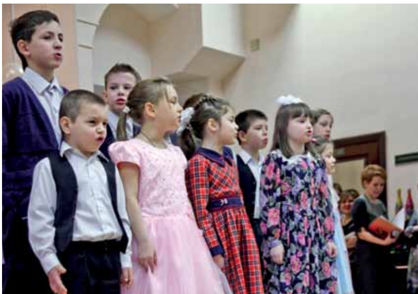
Споем мы песню родному дому!

Социальный приют для детей и подростков расположился в зда-