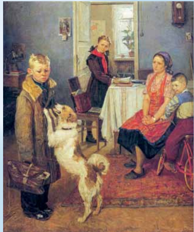
Ф. Решетников. «Опять двойка» (1952 г.)

Кстати, Федор находил у любимого племянника и явные способности к рисованию, и художественный вкус. Показывая ему свою новую работу, всег-