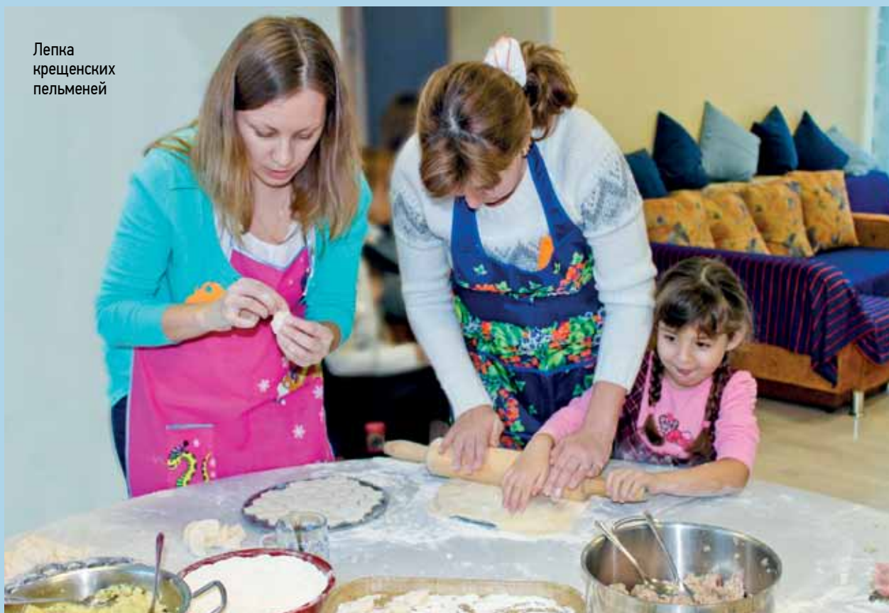
Лепка крещенских пельменей

тивного 15-минутного творчества получилась оригинальная и, главное, нужная в хозяйстве вещь: чудный абажур из белоснежных бумажных... ладошек. Его сразу же «оживили» – надели на лампу.