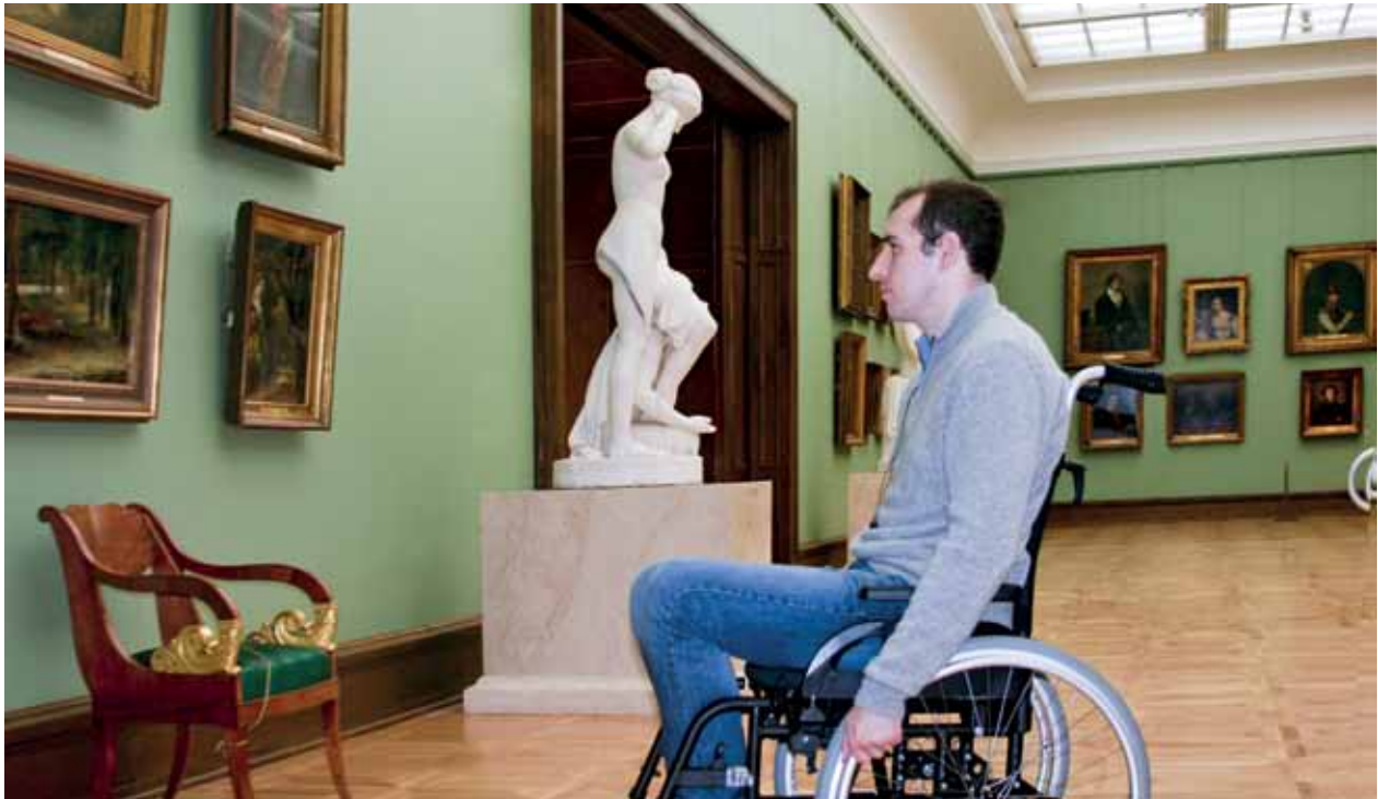
Искусство, доступное для всех

на Крымском Валу заняла пятое место. Оценивались несколько параметров: возможность подъезда, самостоятельного прохода инвалида-опорника в музей и в залы экспозиции, доступность инфраструктуры – киосков, туалетов. Мы были несказанно рады, что наши старания оценили.