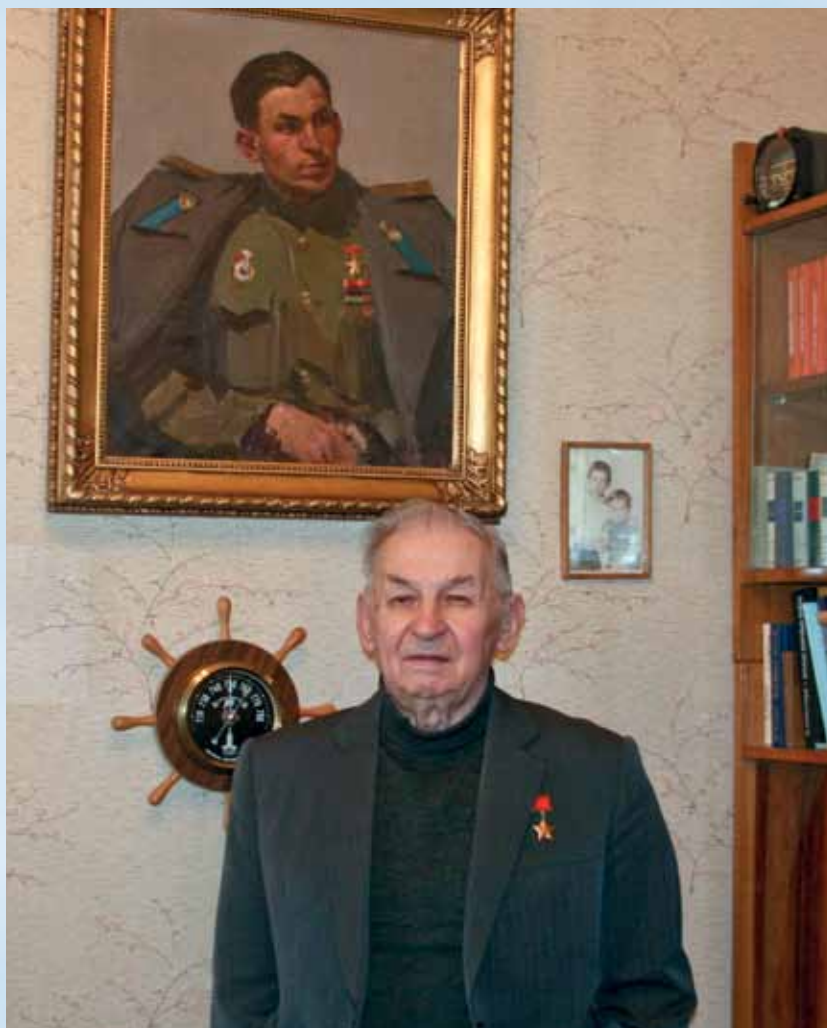
Этим портретом я очень дорожу. Мне здесь 29! (2014 г.)

в мастерскую к Федору попрощаться. Но он прямо с порога усадил меня в кресло, повертел туда-сюда, показал точку, куда надо смотреть, и взялся за кисти.