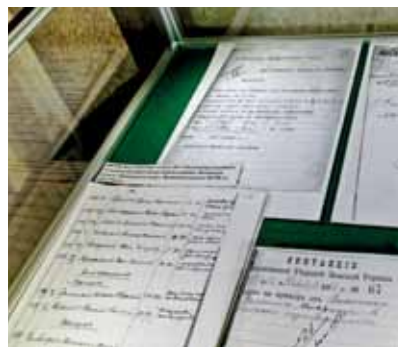
Старинные документы Московской губернии

ставшие Волгоградским и Люблинским. Был организован учебно-курсовой комбинат Москхлеба, работали 2 ВТЭК – Ждановская и Калининская. Отдел социального обеспечения Калининского района находился на Красноказарменной улице, а отдел поселкового совета Ждановского района – в доме санитарного просвещения в Люблино. На таких крупных предприятиях, как Московский шинный завод, Завод малолитражных машин, часовой завод, завод «Серп и молот», Нефтегаз были организованы комиссии по предварительной подготовке документов для людей, собирающихся на пенсию. Ждановский и Калининский РОСО одними из первых в Москве начали привлекать общественность к работе органов соцобеспечения. Ждановский РОСО первым начал готовить на комиссию дела о назначении пенсий и пособий на льготных условиях. Завод малолитражных машин шефствовал над домом престарелых.