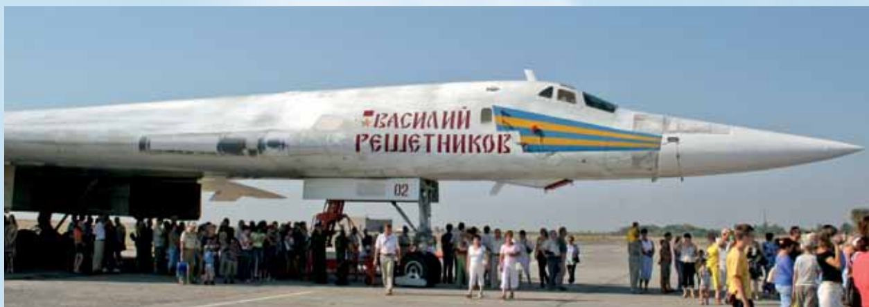
«Василий Решетников» продолжает полет

«Василий Решетников» продолжает полет. ■